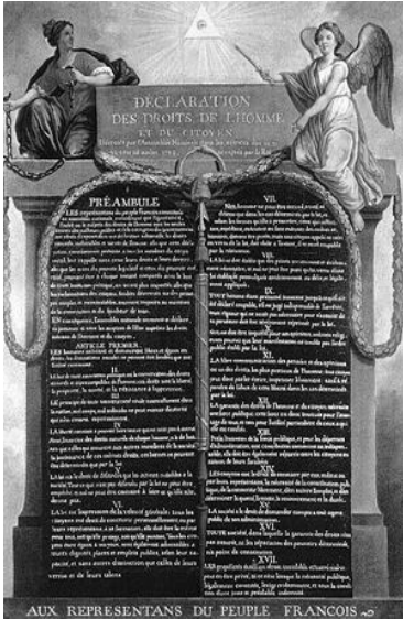
Déclaration universelle des droits de l'Homme